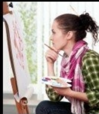
What I think I do.