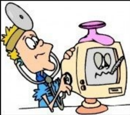
What my friends think I do.