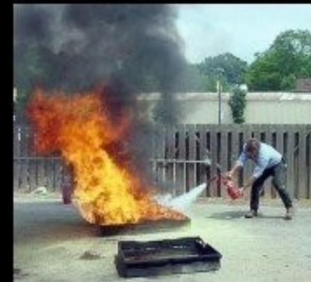
What I actually do.