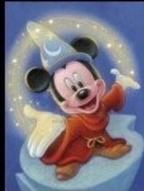
What my mom thinks I do.