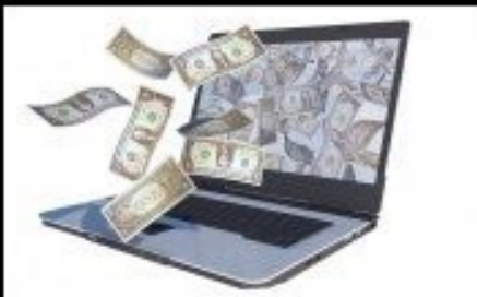
What my boss thinks I do.