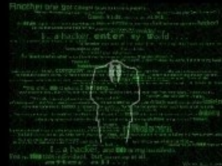
What society thinks I do.